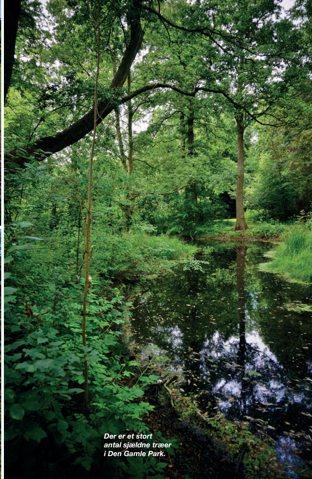
Der er et stort antal sjældne træer i Den Gamle Park.