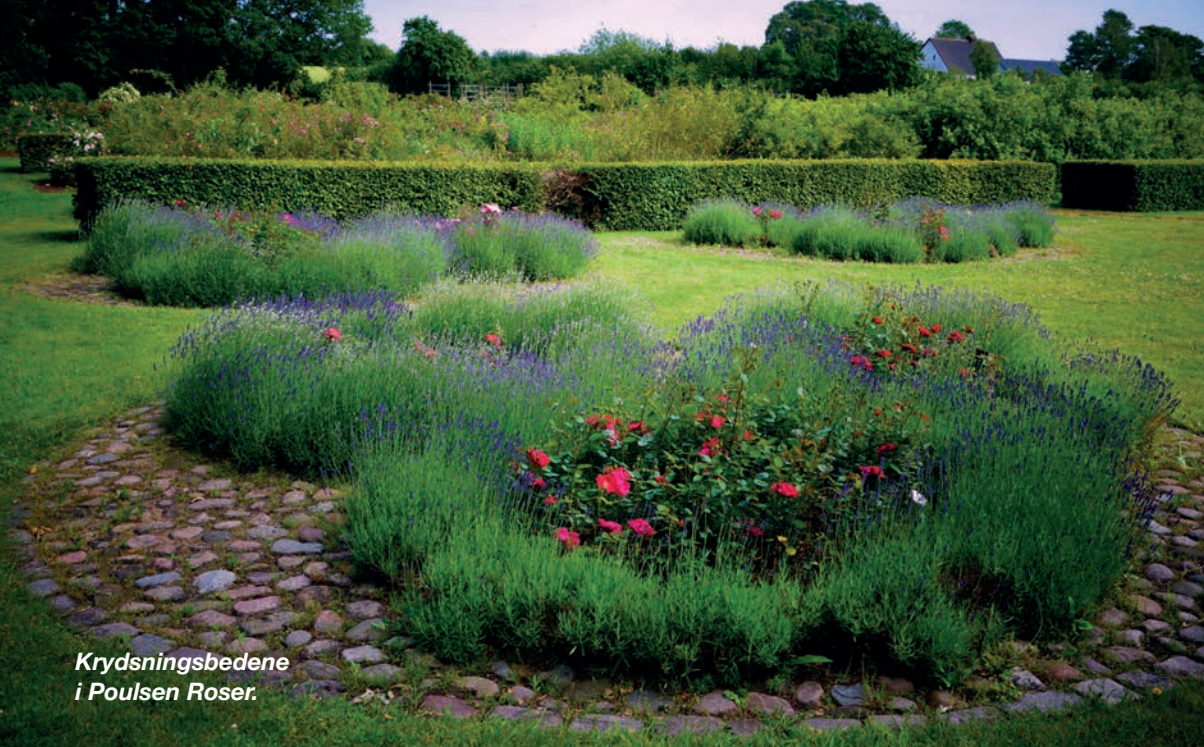
Krydsningsbedene i Poulsen Roser.